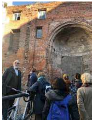
Überregionale Exkursion in die geschichtlichen Stätten des Judentums in Hamburg