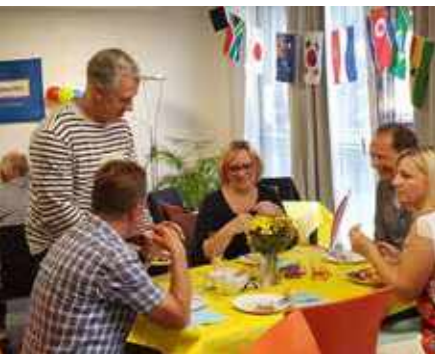
Sprachbrücken-Sommerfest im Nachbartschaftstreff LeNa in Billstedt

Das Engagement jedes*r Einzelnen ist unfassbar wertvoll für „Sprache im Alltag“. Jede*r Ehrenamtliche „spendet“ dem Projekt seine*ihre Zeit, viel Kraft und Ideen zur Weiterentwicklung. Deshalb, aber nicht nur, schreibt Sprachbrücke-Hamburg e. V. Anerkennung groß. Sie zeigt sich in Dankesaktionen, kleinen Aufmerksamkeiten und der ausdrücklich erwünschten Mitgestaltung am Projekt – sie ist aber vor allem Spiegel einer wertschätzenden Haltung.