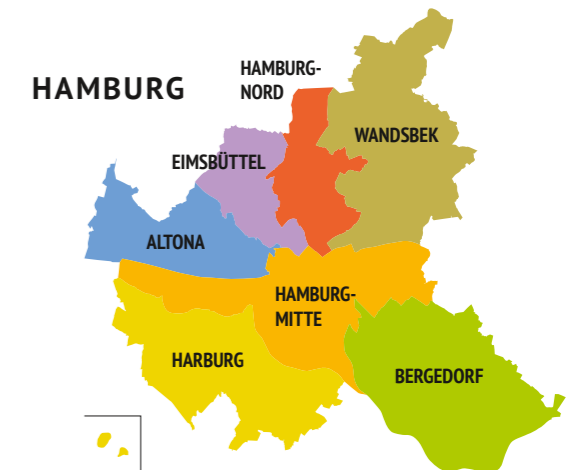
Gesprächsangebote in ganz Hamburg